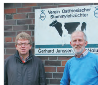
Von X-Zelit überzeugt.

Auf 13 Milchviehbetrieben mit Milchfieberproblemen konnte mit X-Zelit in Praxisversuchen das Milchfiebertvorkommen von 26,4% auf 3,8 % reduziert werden!